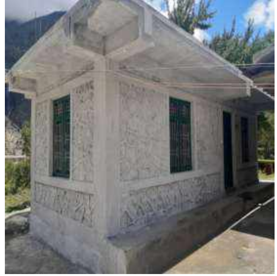
केन्द्रमा नवनिर्मित बिक्रि कक्ष भवन, शितोष्ण