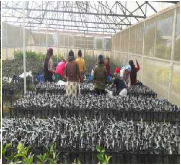
फलफूल विरुवा उत्पादनको लागि कलमी गरिएका बोटहरू, समशितोष्ण बागवानी केन्द्र, किर्तिपुर