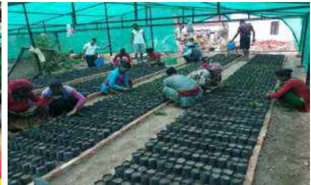
कफी विकास केन्द्र, गुल्मी