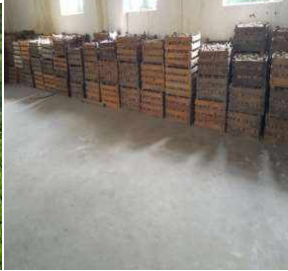
मार्फा चौडापात जातको रायोको बेर्ना उत्पादन तथा बिक्रि र आलुको बेसिक बिउ बिक्रीको लागि भण्डारण गरि राखिएको, शितोष्ण वागवानी विकास केन्द्र, मार्फा मुस्ताङ