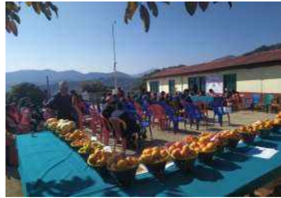
रुटस्टक विरुवा उत्पादन, फार्म स्थापना दिवश, सुन्तलाजात फलफूल विकास केन्द्र