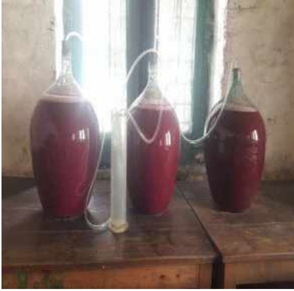
केन्द्रमा आरुबखडा प्रशोधन गरि वाईन बनाईदै वागवानी विकास केन्द्र, मार्फा मुस्ताङ्ग