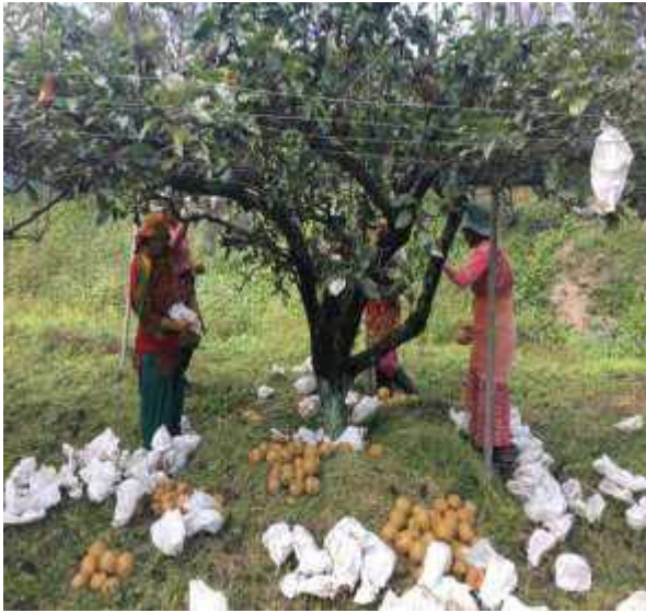
बोटबाट फल टिपेको